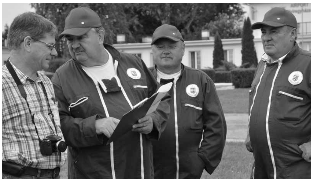
A nyíregyházi repülőtérről szállt fel a helikopter

- A megadott útvonalterv alapján a szükséges eszközök (GPS, fényképező) és jegyzőkönyvek (előre nyomtatott, számozott felvételező lapok) igénybe vételével történt a felderítés. A felvételezésben a földhivatal részéről négy gazdaság, az NTI oldaláról három növényvédelmi és két talajvédelmi felügyelő vett részt a munkában - közölte