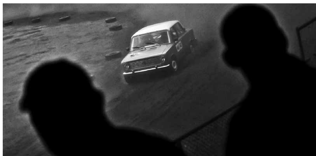
Az amatőr versenyeknek nem csak „hallgatói”, nézői is vannak