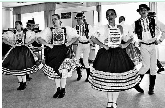
A projektzáró rendezvényét a Lókötő Táncegyüttes nyitotta meg pénteken