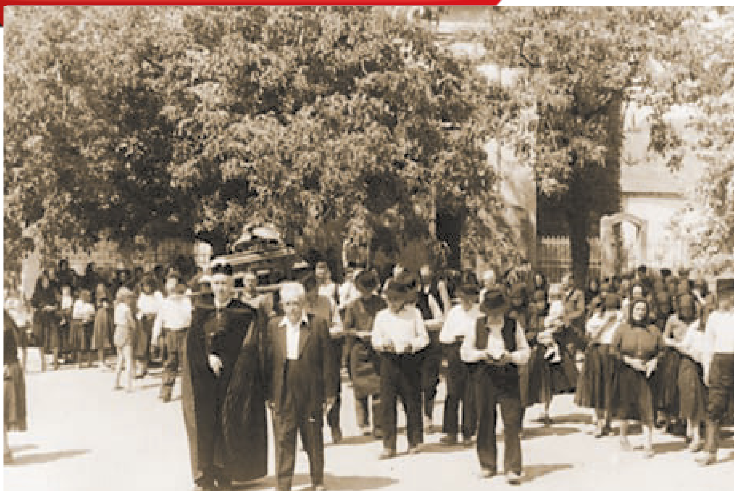
Gyászmenet. Diósjenő, Nógrád m. (Gyűjtötte: Morvay Péter 1963.)

A halálesetet valamelyik férfi hozzátartozó vagy a család megbízottja jelentette be a hatóságoknál és az egyháznál is. A falu a harangozásból értesült, hogy meghalt valaki, s a harangozás módjából tudták meg a halott nemét, korát és társadalmi rangját. A kiharangozás után a rokonoknak, szomszédoknak, ismerősöknek illő volt a halottat meglátogatni. A látogatókat illet a háziaknak megvendégelni, de mivel a házban ilyenkor munkatilalom volt, még a tüzet is eloltották, a szomszédok segítségét kérték.