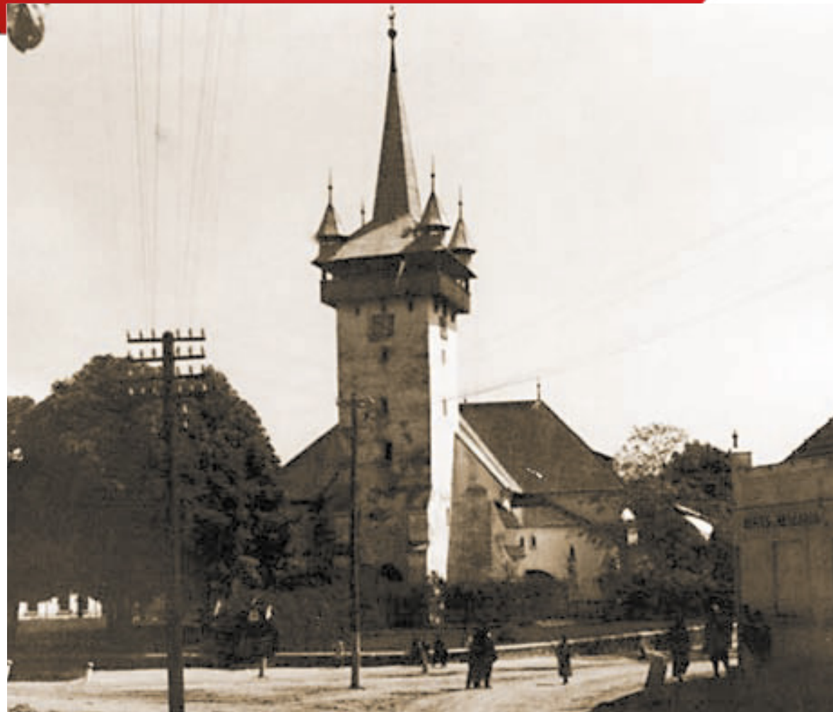
Krasznai református templom. Kraszna, Szilágy m. (Gyűjtötte: Tagán Galimdzsán, 1941)

Az összejövetelek helyszíne korosztályonként más-más volt, de mindig egy nagyobb téren gyülekeztek, hogy legyen elég helyük a szórakozáshoz. Kedvelt helyszínek voltak a patakpart, a keresztutak, a dombtetők, a templomkertek vagy a kút és a templom körüli terek. Ezeket a néprajztudomány szakrális helyeknek, helyszíneknek nevezi. A paraszti társadalom azt tartotta, hogy az itt végzett tevékenység az egész közösségre kihat. A képen a krasznai református templomot látjátok, ami előtt hatalmas tér állt a fiatalok rendelkezésére.