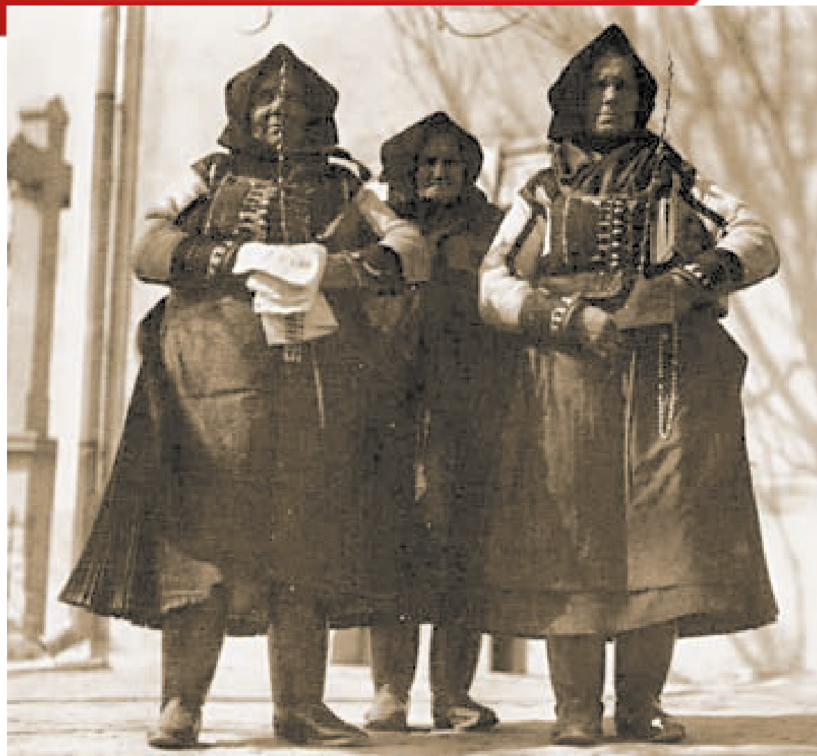
Ködmönös asszonyok virágvasárnap. Tura, Pest m. (Gyűjtötte: Kankovszky Ervin, 1930)

A barkaágakat a nagymise előtt szentelte meg a pap, majd körmenetet tartottak, s csak ezután következett a mise. A megszentelt ágakból aztán mindenki megfogott egyet és hazavitte. A képen látható turai asszonyok is hazafelé sietnek a barkákkal.