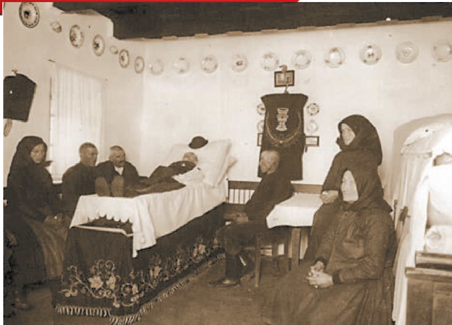
Református halottasház belseje Diósjenő, Nógrád m. (Gyűjtötte: Gönyey (Ébner) Sándor, 1937.)

Ha egy csecsemő köldökzsinórral a nyakán született, biztosak voltak benne, hogy kötéltől fog meghalni. De országszerte elterjedt az a babona is, hogy ha valakinek álmában kihúzzák a fogát, akkor a rokonságából távozik valaki az élők sorából. A házkéményre szállt bagoly, halálmadár is valamelyik ottlakóért jött.