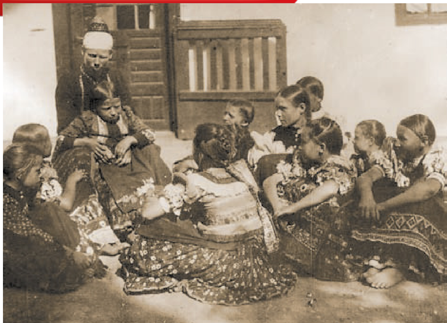
Asszony kisleányokkal. Mezőkövesd, Borsod m. (Gyűjtötte: Gönyey (Ébner) Sándor, 1929)

A kisebbek, ha már elfáradtak, gyakran kuporogtak egy-egy idősebb ember köré, hogy azok történeteit, meséit hallgathassák. Ezen a mezőkövesdi fotón pont úgy ülték körbe a leányok az idősebb asszonyt, mint ahogy azt most az óvodákban teszik a kicsik, akik az óvó néni mellé kuporodnak.