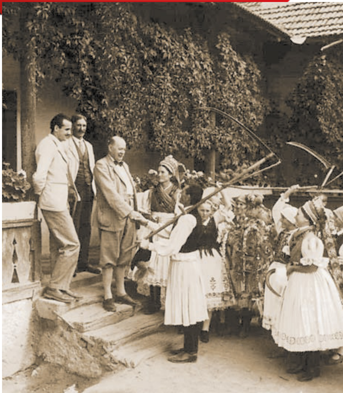
Aratók az uraságnál jelentkeznek Kazár, Nógrád megye (Gyűjtötte: Erdélyi Zoltán 1961)

Sok helyen az először aratókat felavatták, feneküket a földhöz verték, majd a marokszedők elkapták őket, s bekötötték őket. Az első búzaszálaknak, kévéknek nagy jelentőséget tulajdonítottak. Abból adtak a baromfi-nak, hogy azok egészségesek legyenek, az első búzaszálakkal pedig körülkötötték a derekukat, hogy az később ne fájduljon meg a nehéz munkától.