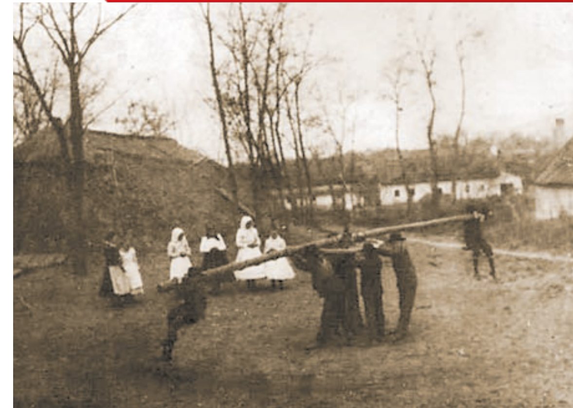
Ördögmotolla. Nagydorog, Tolna m. (Gyűjtötte: Erdélyi Mór, 1907)

A leányok a falu egyik végéből indulva falukerülő játékokkal vonultak végig a falun, amibe a legények is bekapcsolódhattak. A legényekkel együtt aztán párválasztókat, fogócskákat játszottak. Gyakori volt, hogy akik ilyenkor egymást választották, azok házasságot is kötöttek később.