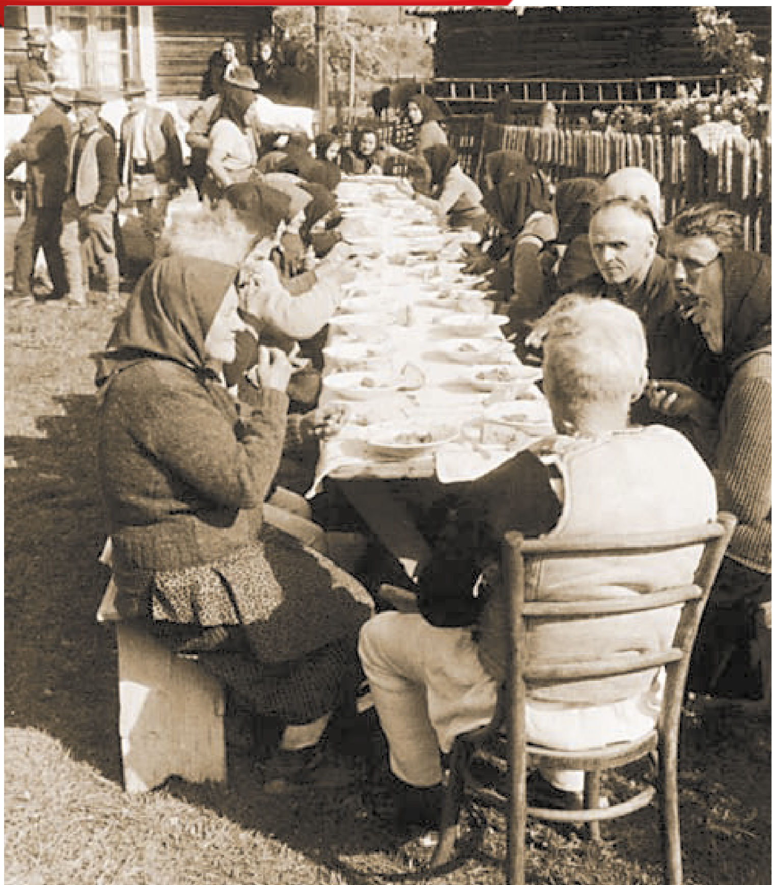
Halotti tor. Gyimesközéplak, Csík m. (Gyűjtötte: Hofer Tamás 1968.)

A temetés után ülték meg a halotti tort, ami az elhunyt emlékezetére ült lakoma volt. Ide nem mehetett mindenki, csak akit a hozzátartozók meghívtak. Miután mindenki az asztalhoz ült, egy közös imát mondtak el vagy a pap vagy a kántor vezetésével. Az asztali áldás után egyszerűbb ételeket szolgáltak fel a vendégeknek. Ez alól az a halotti tor volt kivétel, ahol az elhunyt fiatal volt, és nem házasodott meg. Erre vonatkozóan több adat is van, hogy ilyen esetben az ételek sorrendje, mennyisége olyan volt, mintha a halott lakodalmát ülték volna meg. A toron legtöbbször egy hosszú asztalhoz vagy asztalokhoz ültek le, akár csak a lakodalmakon.