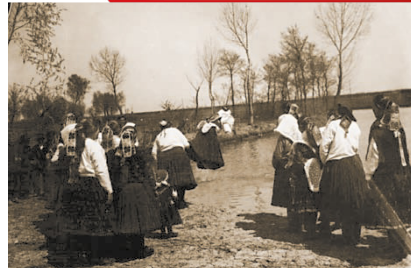
Kiske Bőjttemető menet. Boldog, Pest m. (Gyűjtötte: Gönyey (Ébner) Sándor, 1933)

A kiske vagy kisi egyébként egy szegényes savanyúleves, amit böjt idején ettek, a sódar pedig a sonka volt. Így vitték tehát ki a böjtöt, s hozták be a bőséget. Hazafelé aztán már együtt játszottak a legények és a leányok kapus- vagy hidasjátékokat.